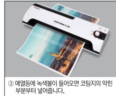
③ 예열등에 녹색불이 들어오면 코팅지의 막힌 부분부터 넣어줍니다.