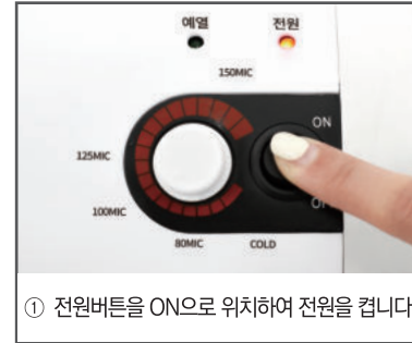
① 전원버튼을 ON으로 위치하여 전원을 켭니다.