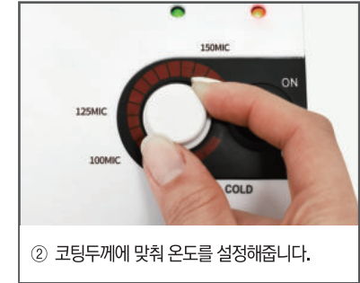
② 코팅두께에 맞춰 온도를 설정해줍니다.