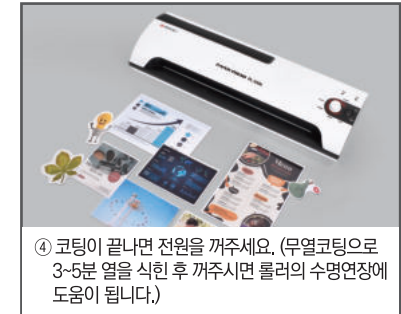
④ 코팅이 끝나면 전원을 꺼주세요. (무열코팅으로 3~5분 열을 식힌 후 꺼주시면 롤러의 수명연장에 도움이 됩니다.)